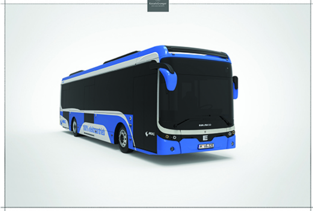
Designstudie; Foto: EBUSCO

Die Stadtwerke München (SWM) beschaffen für die MVG bis zu 40 weitere Elektrobusse. Die ersten sechs wurden jetzt bestellt. Es handelt sich dabei um vier E-Solobusse (12 Meter lang) und zwei E-Gelenkbusse (18 Meter lang). Die Solobusse werden im zweiten Halbjahr 2019 in München erwartet und sind für die erste reine E-Buslinie der MVG vorgesehen. » mehr