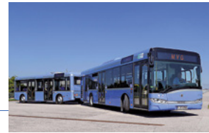
Der neue U-Bahn-Gliederzug C2 hat eine Länge von ca. 115 m (mit Kuppelung) und bietet 940 Fahrgästen Platz.