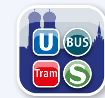
MVG Fahrinfo München