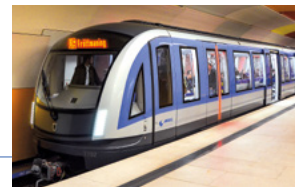
Der neue U-Bahn-Gliederzug C2 hat eine Länge von ca. 115 m (mit Kuppelung) und bietet 940 Fahrgästen Platz.