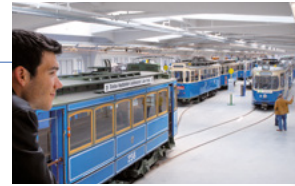
Am 27. Oktober 2007 öffnete das MVG Museum in der Ständlerstraße erstmals seine Pforten für Besucher.