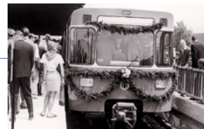
1971: Rechtzeitig vor Eröffnung der XX. Olympischen Sommerspiele erhielt München seine U-Bahn.