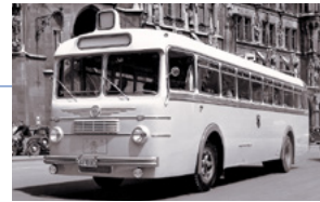
Und auch neue Busmodelle »eroberten« in den 50er Jahren sehr schnell Münchens Straßen.