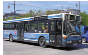
Einsteigen leicht gemacht: In den 1990er Jahren kommen immer mehr Niederflrbusse zum Einsatz.