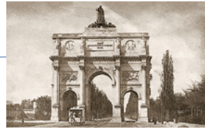
Die Geschichte der heutigen MVG begann 1876 mit der Pferdebahn – hier zu sehen auf der Ludwigstraße.