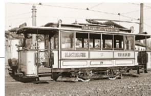
Knapp 12 Jahre später fuhren die ersten elektrischen Trambahnen durch München.