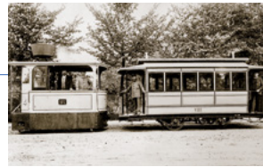
In den 80er Jahren des 19. Jahrhunderts hatten Dampftrambahnen schon mehr als nur eine Pferdestärke.