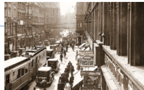
Schon in den 1920er und 30er Jahren ging es auf Münchens Straßen turbulent zu: ein Blick in die alte Theatinerstraße.