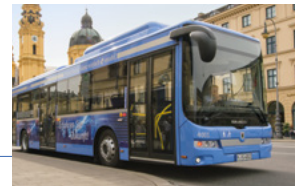
Die ersten Solo-Elektrobuse nutzen Lithium-Eisen-Phosphat-Akkumulatoren mit einer Kapazität von rund 300 Kilowattstunden als Energiespeicher.