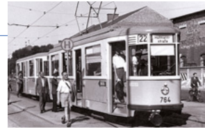
Der M-Wagen – hier im Bild ein Wagen der Vorserie M 1.62 – wurde 1950 erstmalig gebaut.